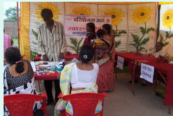
View of Camp