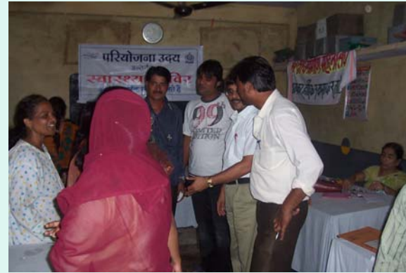
Member Counselor getting the information's from CGC member's