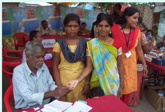
Blood Test of Patient