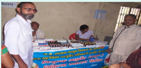
The team of Doctor and ANM