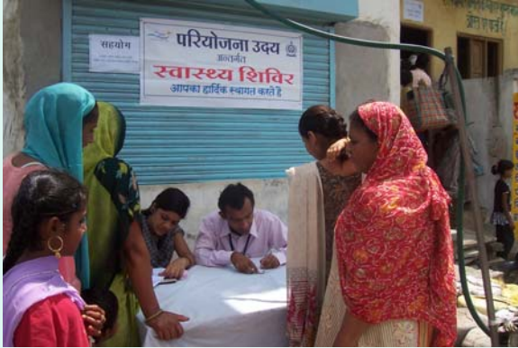
View of Registration