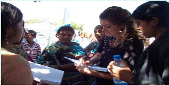
Guest writing on Visitor,s book of CGC