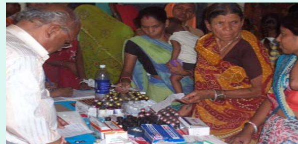
Patients are getting medicines