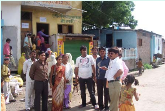
BGMS Supervisor, CGC members outside the Madarsa Hall