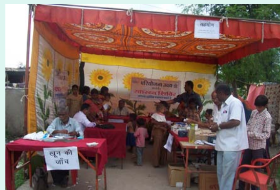
Everyone is busy in camp