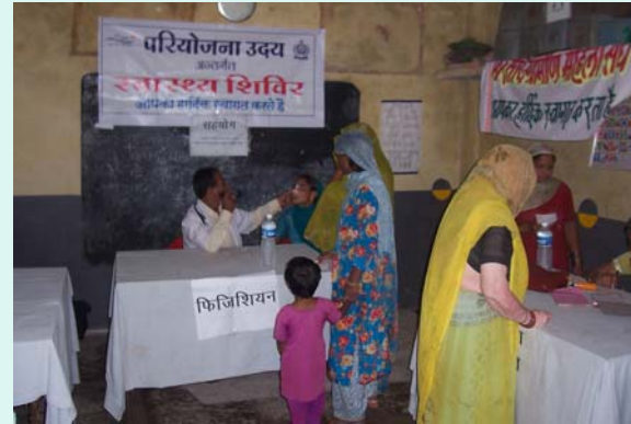
Lady Doctor ( Right side) busy in consultation