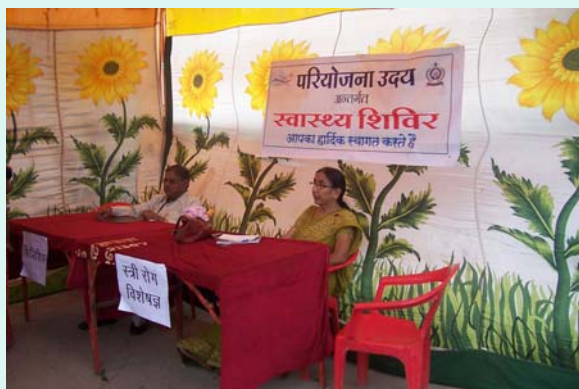
Lady Doctor & Physician