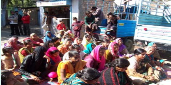
Meeting with CGC & Community