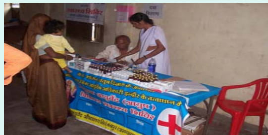
Medicines for Patient