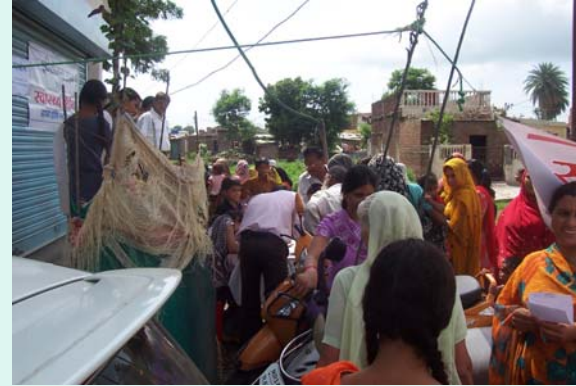
View of Registration