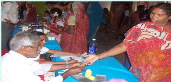
Blood Test of Patient