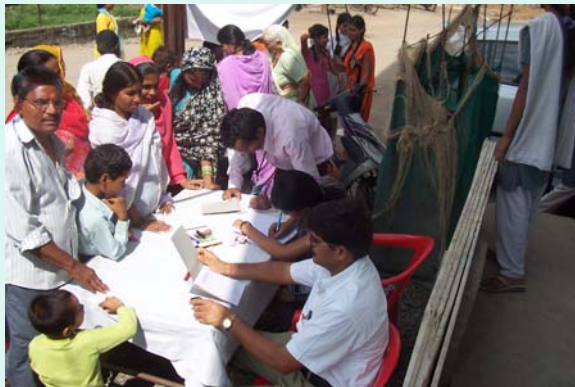
View of Registration