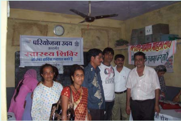
CGC Members with CDO, CDE & Member Counselor