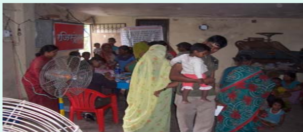
Registration of Patient