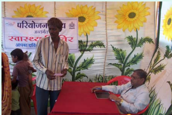
Doctor Consulting Patient