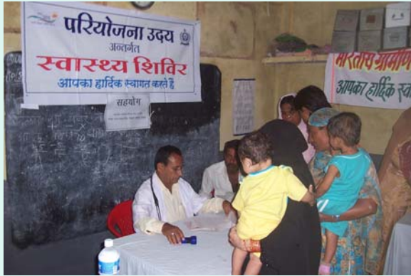
Physician busy in Consultation