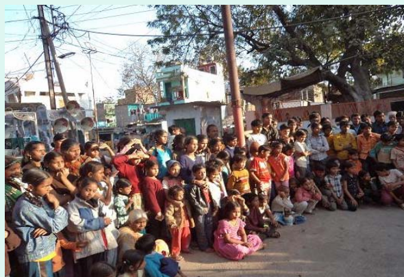
Street play and awareness activity on HIV/AIDS at slums