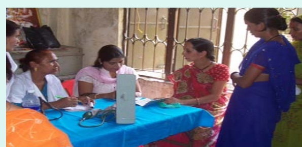
Gerontologist checking the patient