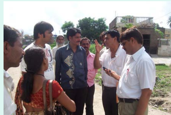
CDE giving information's on AIF CIF work to Member Counselor