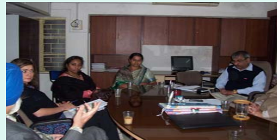
Meeting at PIU, Indore