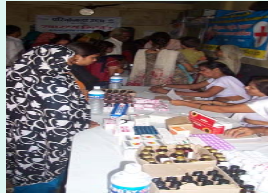
Free Medicine's distribution to patients