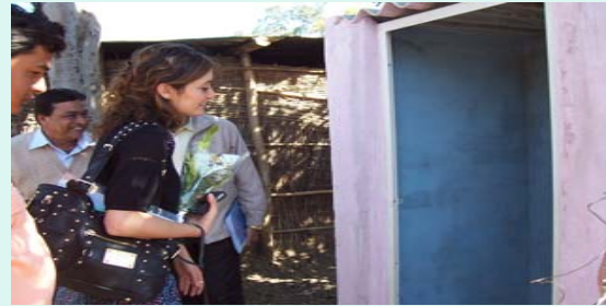
Inspection of IHHT