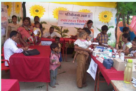
Doctor's , Patients & Medicine's