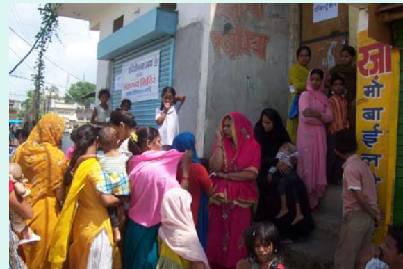
Waiting for the turn