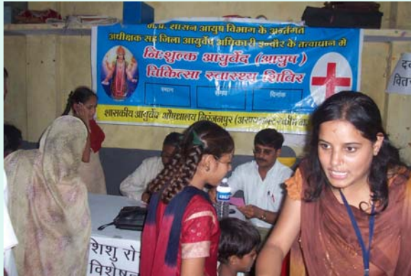
Volunteer from social work institute, behind child specialist busy in work