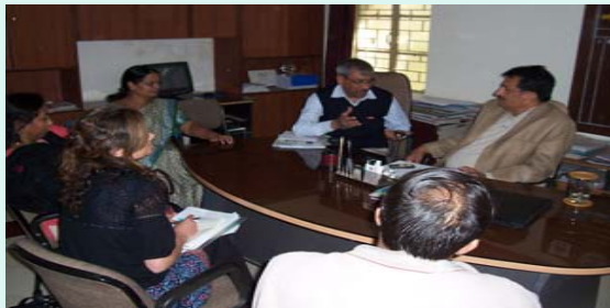
Meeting with PM, PIU, Indore